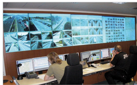
Reportáž z Národního dopravního informačního a řídicího centra (str. 28)