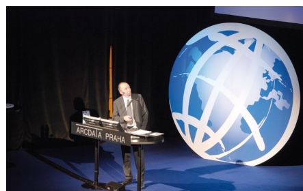
Reportáž: Sedmnácté setkání uživatelů GIS ESRI v České republice (str. 13)