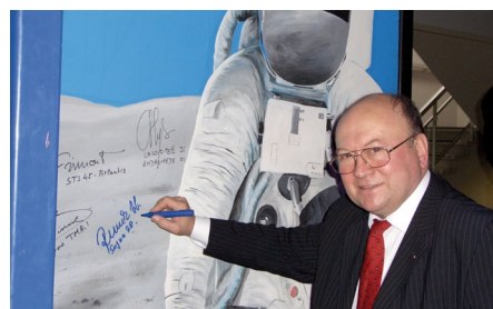
Vladimír Remek: Galileu máme co nabídnout (str. 33)